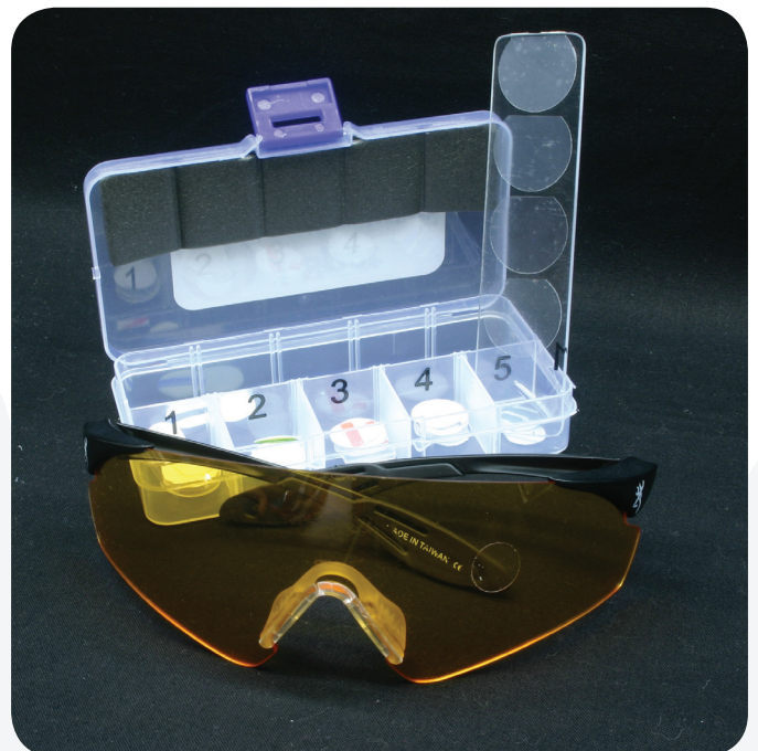
Angepasste und modifizierte Schiessbrille

Sprechen Sie uns an, wir haben für jedes Problem die passende Lösung.